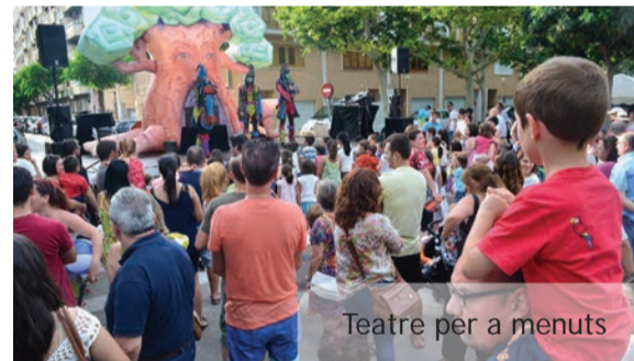
Teatre per a menuts