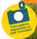
Foto galeria disponible al web municipal

Video disponible a: picanya.tv Televisió local per Internet