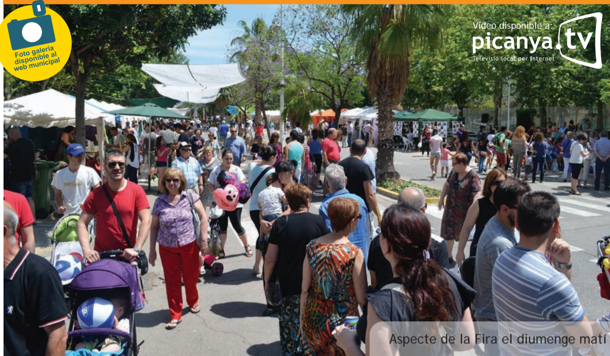
Aspecte de la Fira el diumenge matí

Video disponible a: picanya.tv Televisió local per Internet