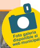
Foto galeria disponible al web municipal

Vídeo disponible a: picanya.tv Televisió local per Internet