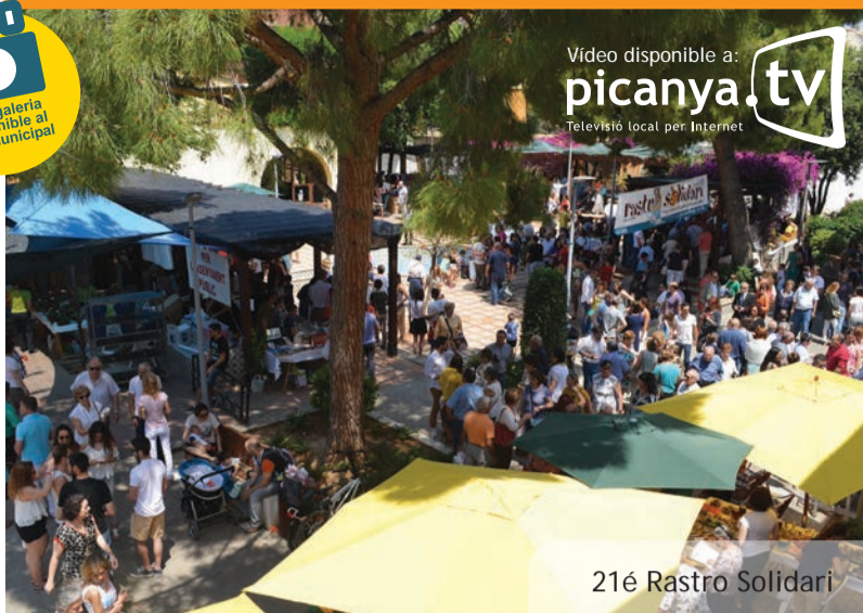
21é Rastro Solidari

Video disponible a: picanya.tv Televisió local per Internet