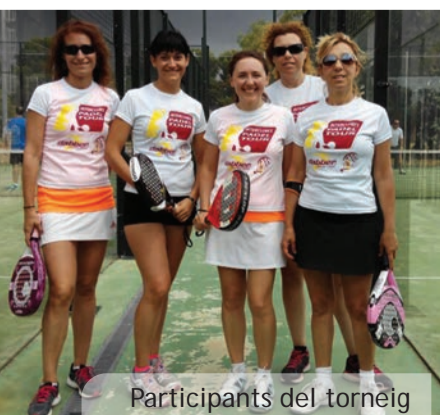
Participants del torneig

EI 13 de juny se celebrà a les pistes del poliesportiu la 5a edició del torneig de pàdel solidari organitzat cada any amb l'objectiu de recaptar fons per al Rastro Solidari. En esta ocasió foren 10 les parelles participants cosa que suposa una recaptació de 200 €. Cal destacar especialment l'increment de la participació de dones.