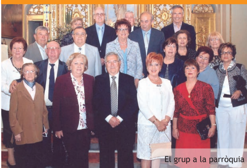
El grup a la parròquia