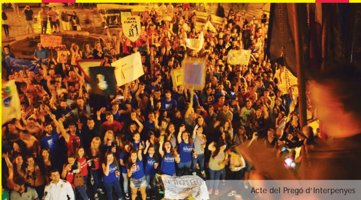
Acte del Pregó d'Interpenyes