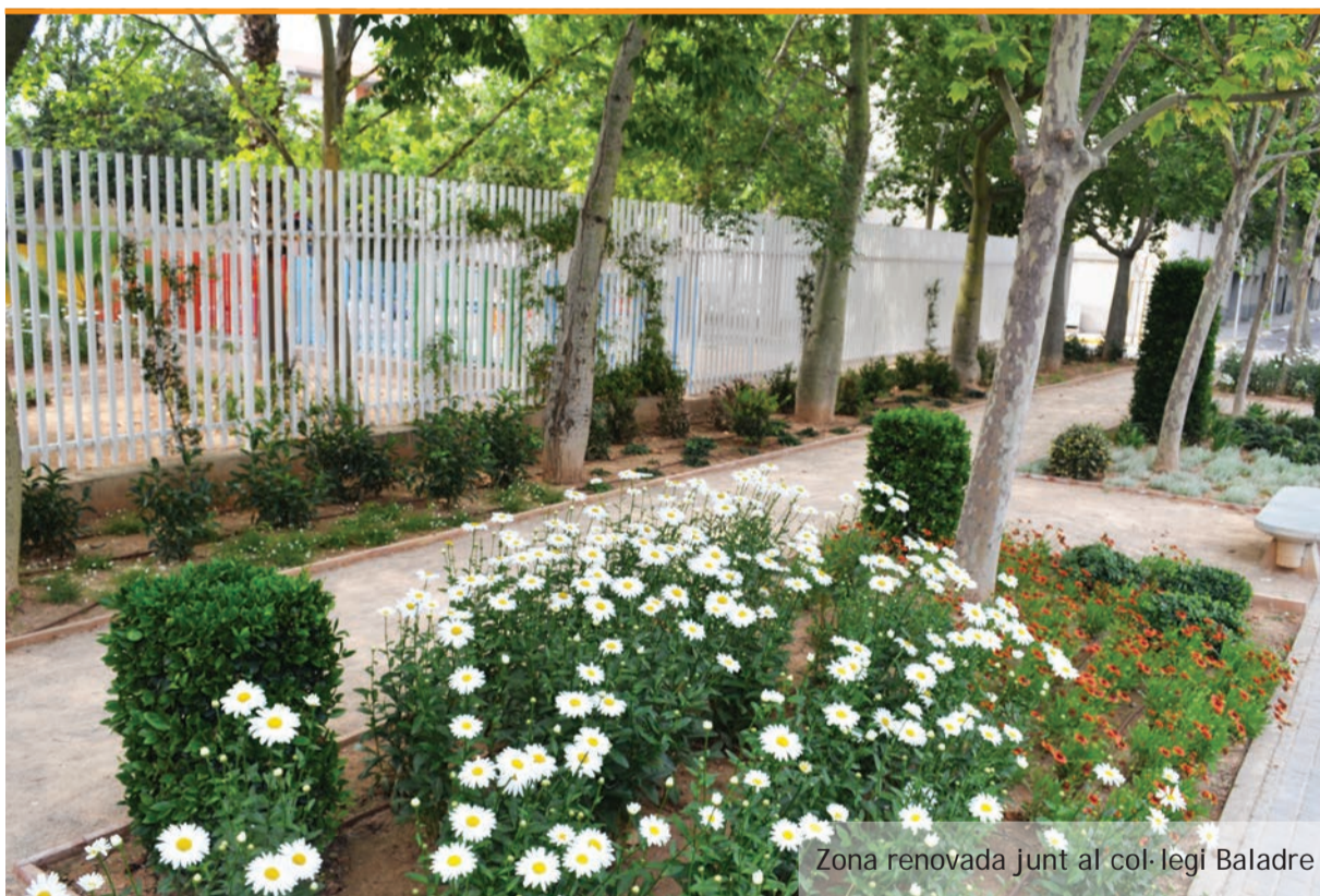
Zona renovada junt al col·legi Baladre

D'esta manera queden units el carril bici de 9 d'octubre amb el carril bici de la zona de Picanya Sud i, tot i salvant la zona de l'estació, també es pot accedir al tram del parc Jaume I.