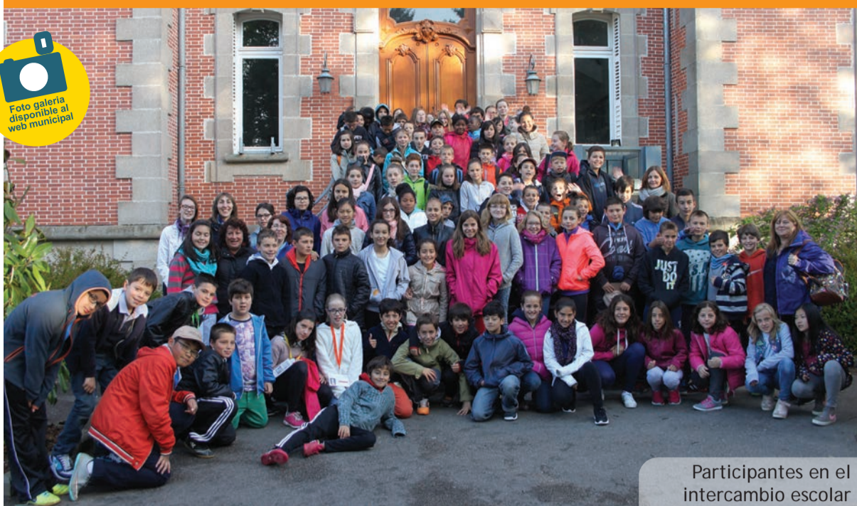
Participants en el intercambio escolar