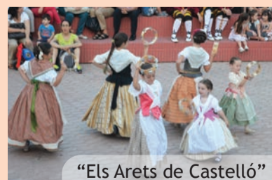
“Els Arets de Castelló”