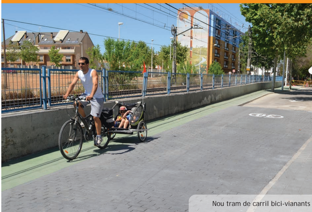
Nou tram de carril bici-vianants