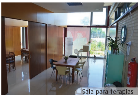
Sala para terapias

La apertura de este Centro de Día también supone un importante beneficio para las personas mayores que viven en el conjunto de viviendas adaptadas anexo al Centro dado que podrán acceder a servicios como comedor, talleres, charlas y contar con un apoyo más directo en caso de cualquier necesidad inmediata que pueda surgir.