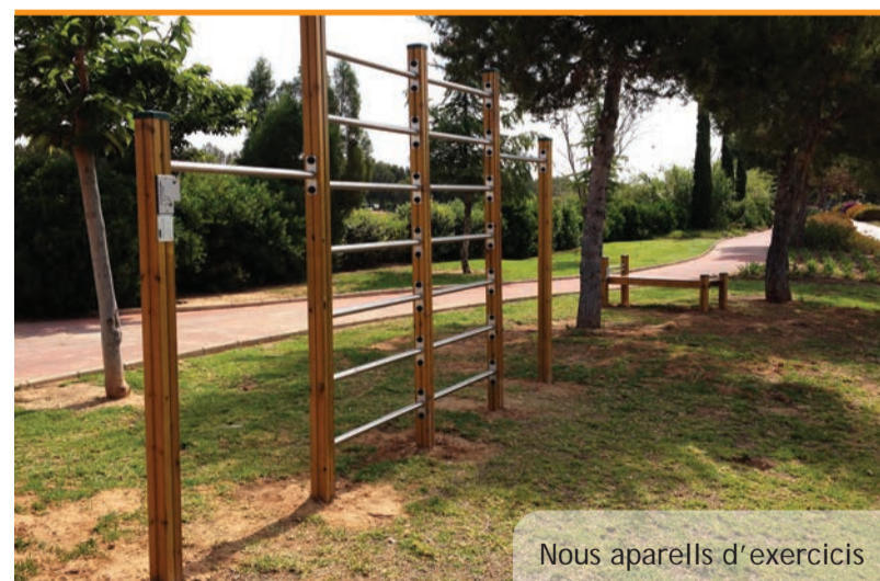
Nous aparells d'exercicis

En la calle Valencia, en el acceso al puente, se ha reordenado el espacio, se ha renovado la pavimentación y se han retirado algunos elementos. De esta manera se ha mejorado de forma muy significativa la transitabilidad de la zona para los peatones en esta cambio de nivel entre la calle y el puente que, desde ahora, se puede resolver de forma mucho más cómoda.