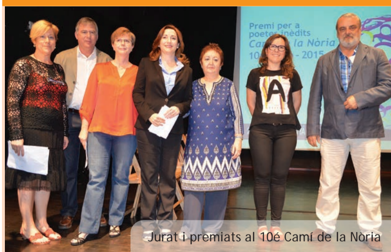
Jurat i premiats al 10é Camí de la Nòria