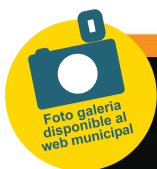
Foto galeria disponible al web municipal