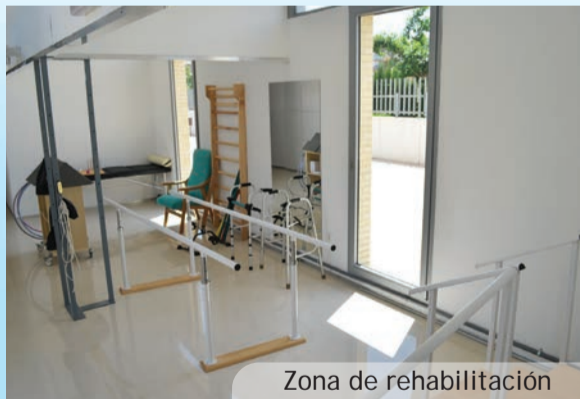
Zona de rehabilitación