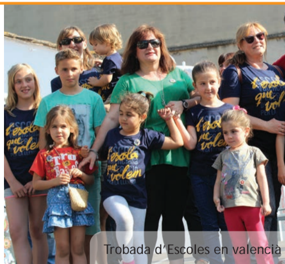
Trobada d'Escoles en valencià