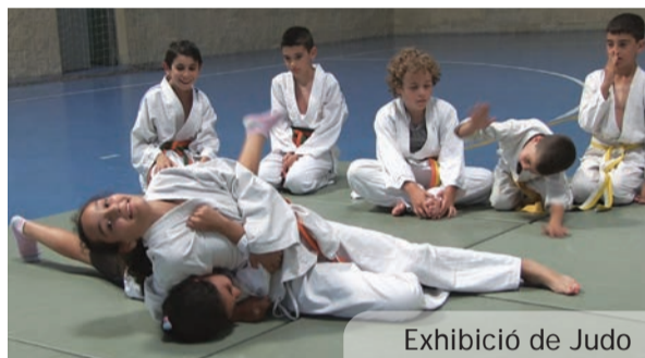
Exhibició de Judo

Com cada any, el "plat fort" va arribar amb la celebració de la Mini-Olimpiada, tota una vesprada de proves atlètiques al Poliesportiu, en la que l'alumnat dels diferents centres educatius del nostre poble disfruta al màxim en companyia de familiars i amics.