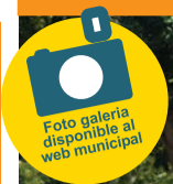
Foto galeria disponible al web municipal

Video disponible a: picanya.tv Televisió local per Internet