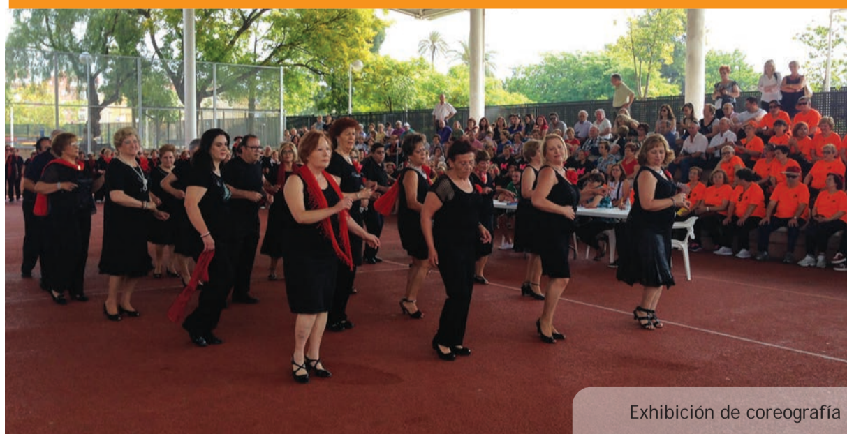
Exhibición de coreografía