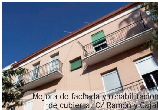
Mejora de fachada y rehabilitación de cubierta. C/ Ramón y Cajal