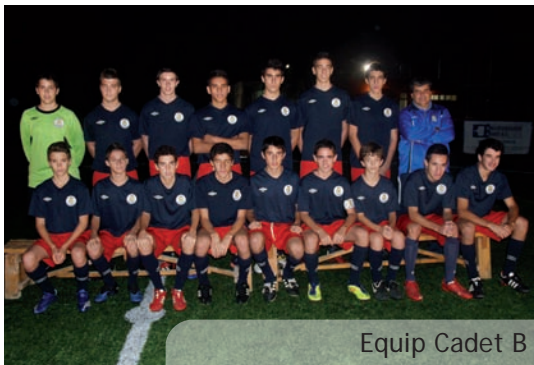
Equip Cadet B