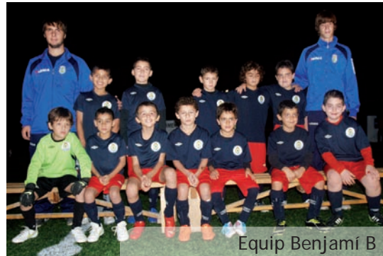
Equip Benjamí B