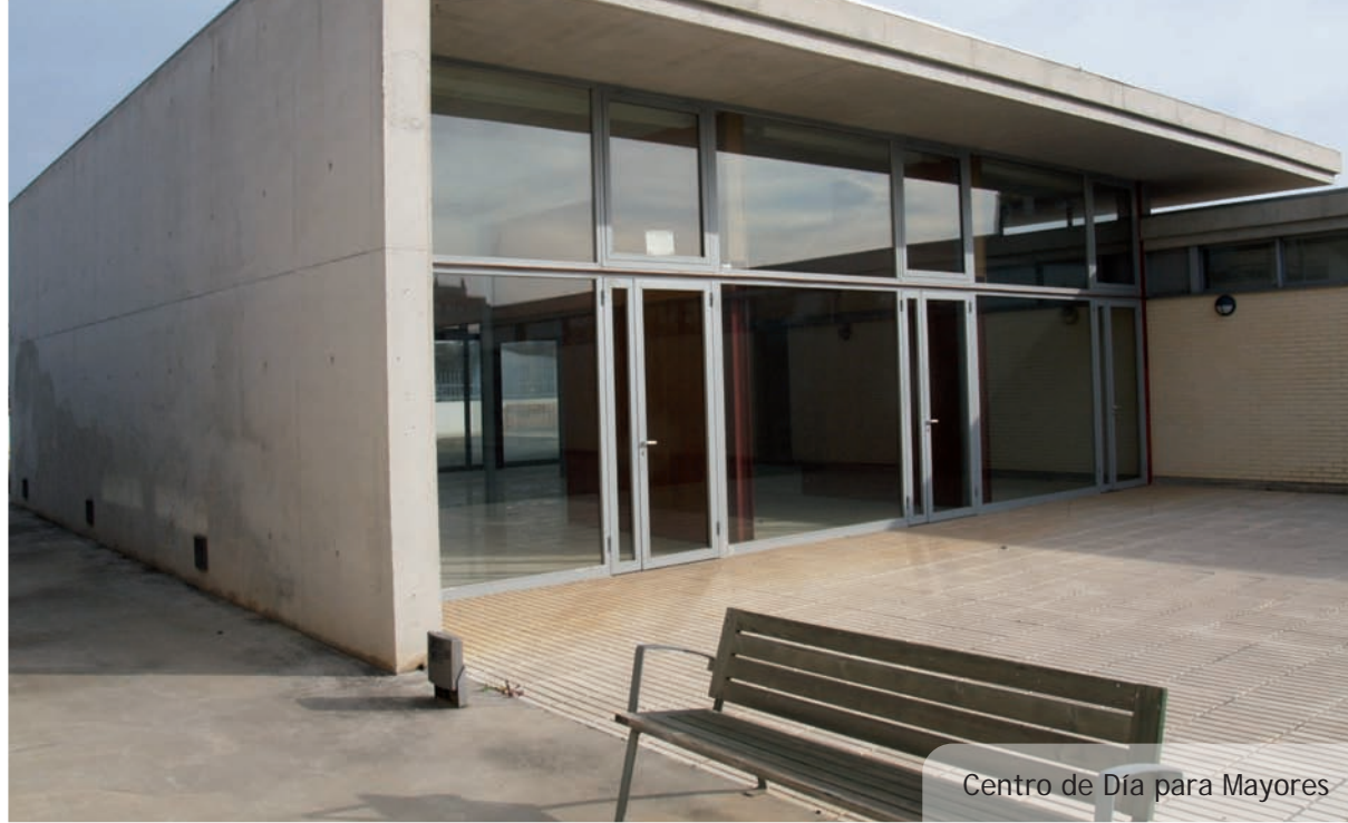
Centro de Día para Mayores

El "Fandango de germanor", ballat per tots els i les participants al voltant de la foguera tanca sempre l'Aplec.