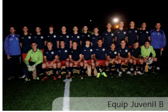
Equip Juvenil B