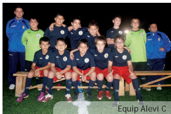
Equip Aleví C

Impressió: Gràfiques Vimar SL Dipòsit legal: V-257-1992