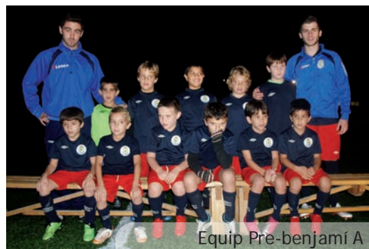
Equip Pre-benjamí A