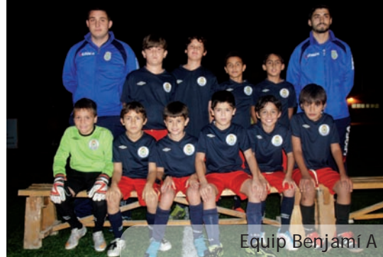
Equip Benjamí A