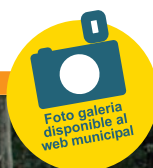
Foto galeria disponible al web municipal