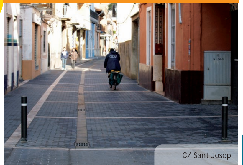
C/ Sant Josep