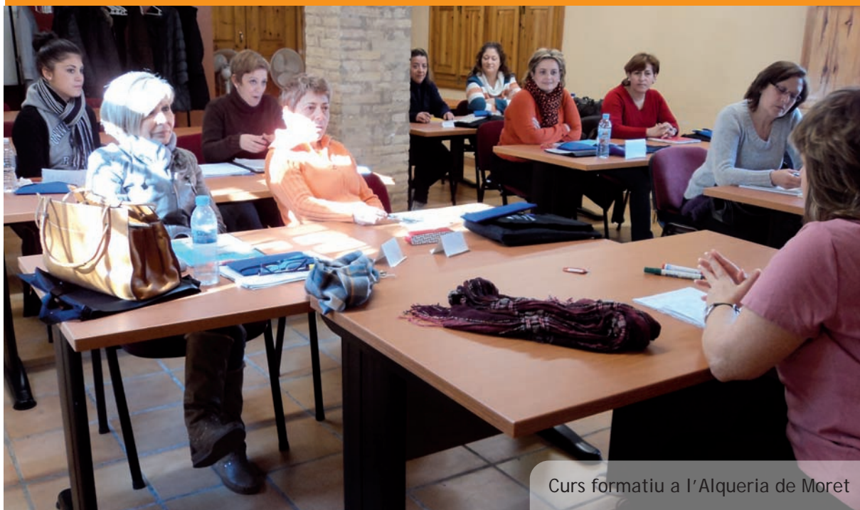
Curs formatiu a l'Alqueria de Moret