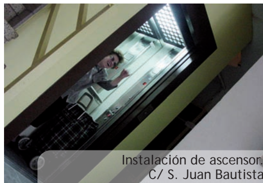
Instalación de ascensor. C/ S. Juan Bautista