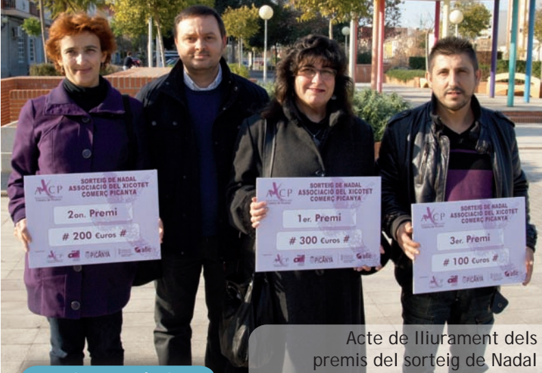
Acte de lliurament dels premis del sorteig de Nadal

Aquests Nadals l'Associació del Xicotet Comerç de Picanya també tornà a organitzar el sorteig de premis de 300, 200 i 100 € per a realitzar compres als establiments associats