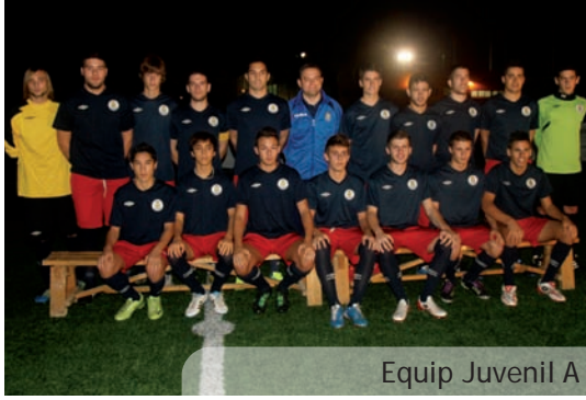
Equip Juvenil A