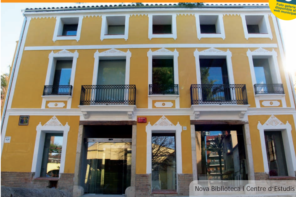
Nova Biblioteca i Centre d'Estudis

Foto galeria disponible al web municipal