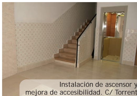
Instalación de ascensor y mejora de accesibilidad. C/ Torrent

Ahora el Servicio de Vivienda junto al departamento de Urbanismo serán los encargados del asesoramiento y gestión de ayudas de aquellos vecinos y comunidades que quieran acogerse a las ayudas del Plan ARI y mejorar así sus viviendas. Un nuevo proyecto que, sin duda, seguirá mejorando la calidad de vida de vecinos y vecinas.