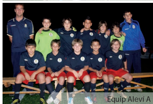
Equip Aleví A