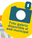
Foto galeria disponible al web municipal