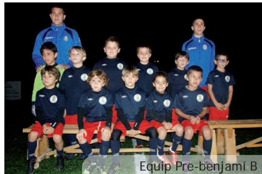
Equip Pre-benjamí B