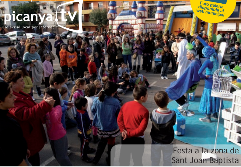
Festa a la zona de Sant Joan Baptista