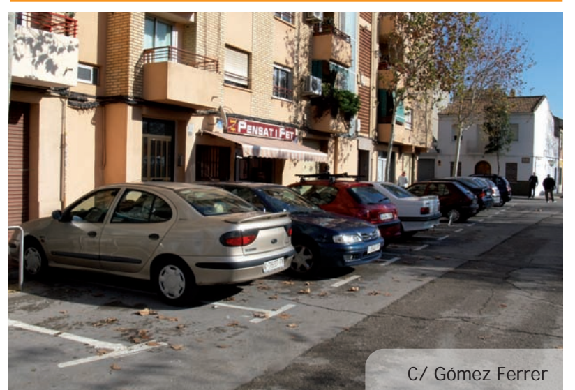
C/ Gómez Ferrer

volupat en obres anteriors amb la creació de passos elevats per a vianants, molt ben valorats per la població i la consegüent eliminació d'entrebancs arquitectònics, substitució de paviments, millores als escocells dels arbres, etc.