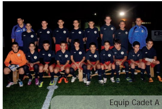
Equip Cadet A