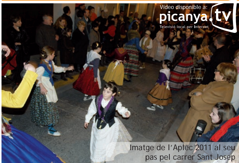
Video disponible a: picanya.tv Televisió local per Internet

de la vida actual d'una manera molt personal entre colors càlids i llums i ombres.