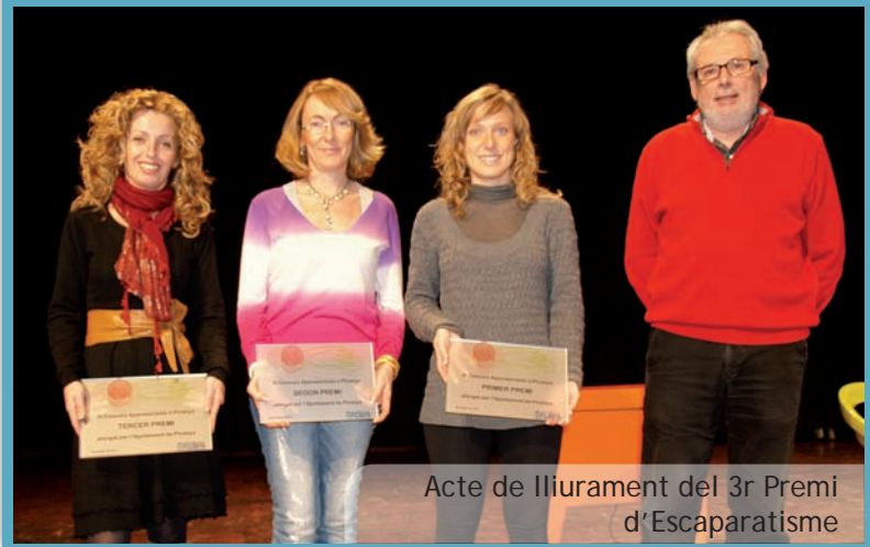
Acte de lliurament del 3r Premi d'Escaparisme