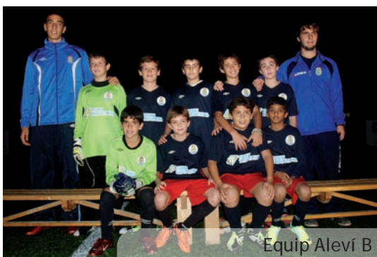
Equip Aleví B