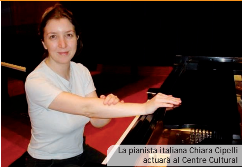
La pianista italiana Chiara Cipelli actuarà al Centre Cultural