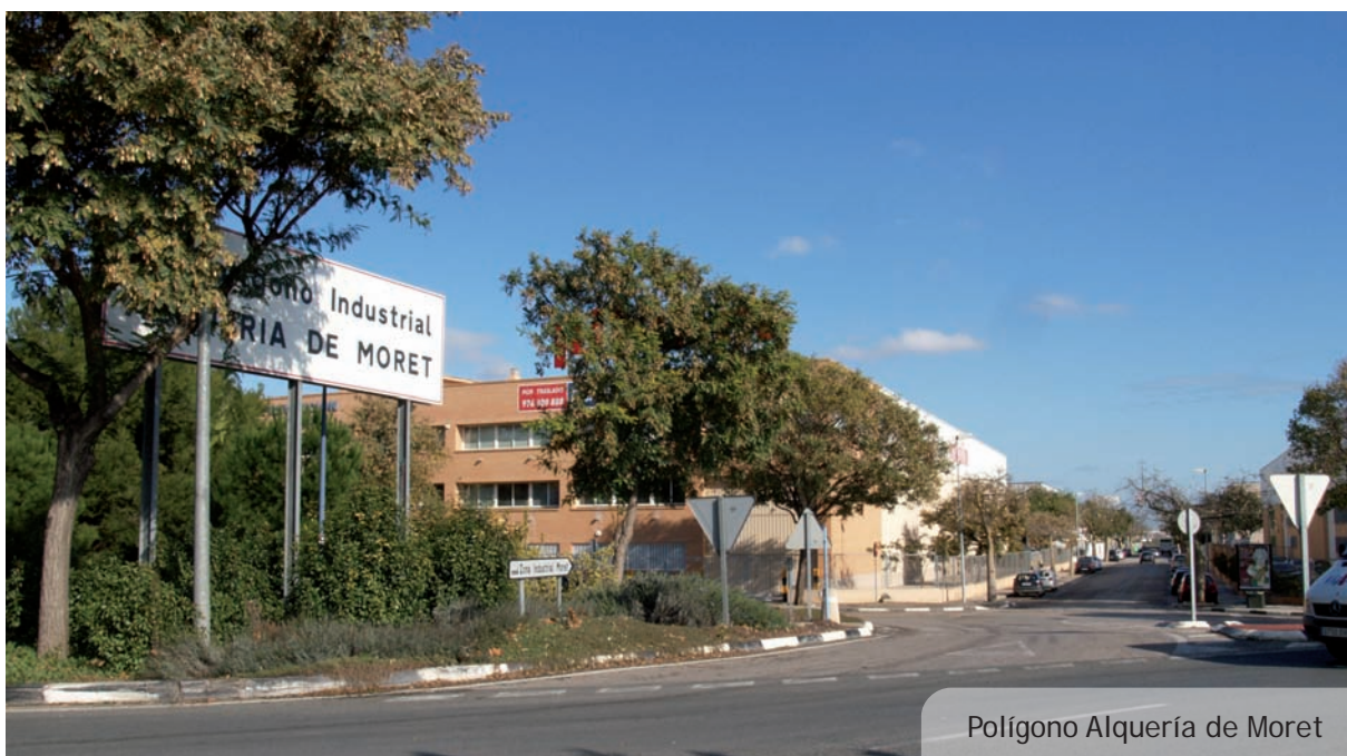
Polígono Alquería de Moret

Aquest programa està organitzat per l'Agència de Desenvolupament Local i subvencionat pel SERVEF i pel Fons Social Europeu. L'objectiu final d'aquest programa formatiu és que les alumnes participants puguin adquirir una bona capacitat professional i millorar les possibilitats d'incorporar-se al mercat laboral.