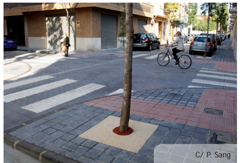
C/ P. Sang

També s'ha previst que, al voltant de la zona d'accés limitat s'instal·len zones de càrrega i descàrrega que permetran l'estacionament de vehicles relacionats amb el subministrament als comerços localitzats a l'interior d'aquesta àrea.