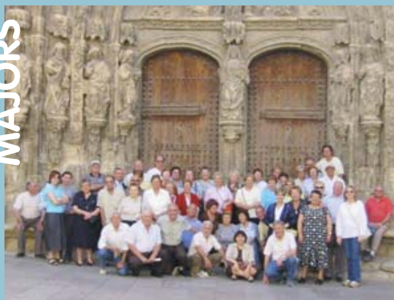
Visita a Requena

Realiza una rutina diaria de actividades, para de ese modo estimular los sistemas corporales de tu bebé, que aprenda a relacionarse con otras personas a aumentar sus sensaciones agradables y a disfrutar con ellas. Renovarás tu energía, estimularás su desarrollo, calmarás sus malestares, aprenderás a relajarte fortaleciendo el vínculo con tu bebé. Que lo disfrutes!