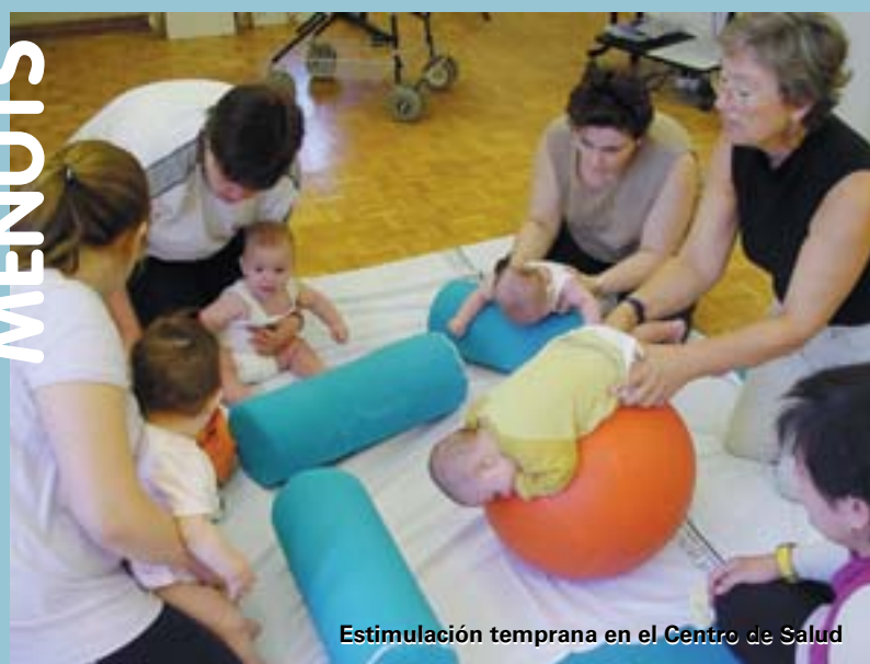
Estimulación temprana en el Centro de Salud

Una obra completíssima que es presenta el 13 de juliol en el context del dia de la festa i que, de ben segur, portarà bona cosa de records a aquells i aquelles que algun dia van omplir les aules del CP Ausiàs March.