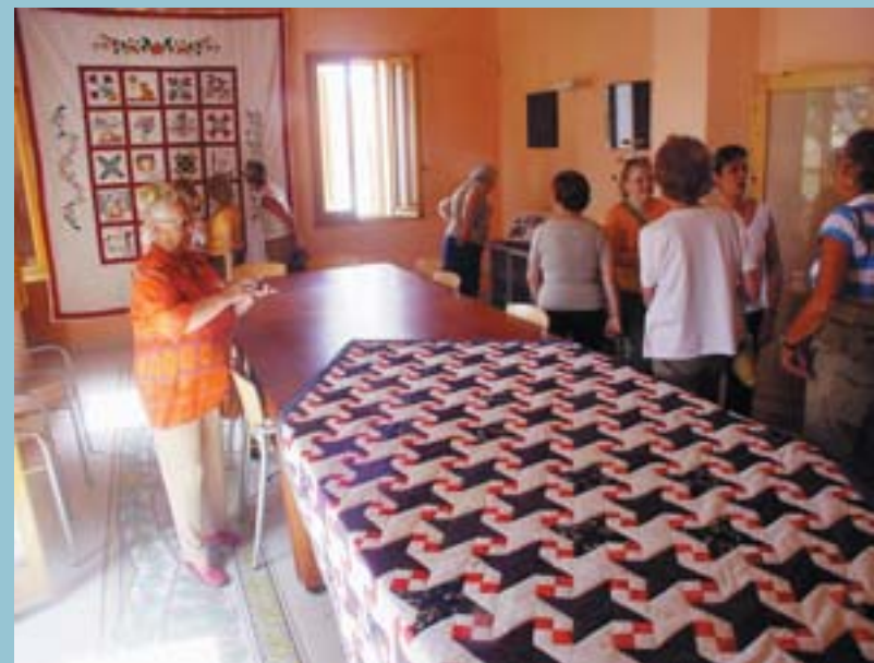
Exposició de Patchwork a l'Alqueria de Moret

El Ayuntamiento de Picanya, a través de la Agencia de Desarrollo Local, se convierte así en la "entidad social" de mediación entre las personas interesadas en poner en marcha un proyecto y la Caixa y actúa como promotor, asesor y supervisor de las diferentes iniciativas propuestas.