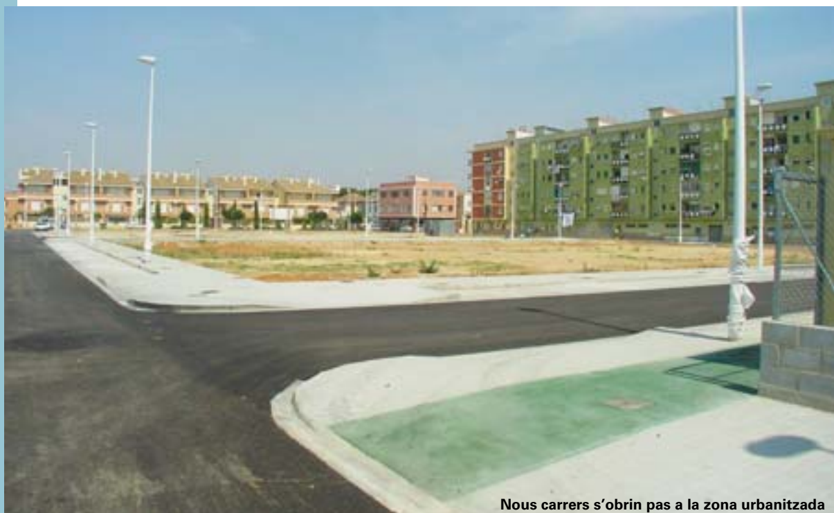
Nous carrers s'obrin pas a la zona urbanitzada

Amb aquesta ordenança, el que es pretén és que les necessitats d'aigua calenta d'ús sanitari estiguen cobertes amb una energia neta i renovable i disminuir així el consum d'altres energies (petroli, carbó, nuclear...) més contaminants i que estan contribuint a l'escalfament i contaminació del planeta amb les seues emissions. Estem per tant, davant un nou pas, en el camí de fer del nostre, un poble sostenible i responsable del seu impacte ambiental.