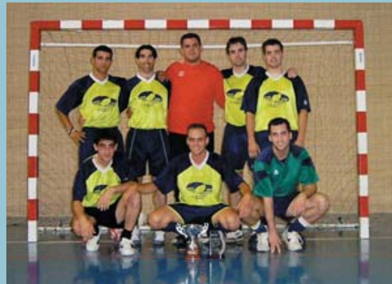
Racing Motos, campions

Tant per a la organització dels Jocs d'Atletisme com per al desenvolupament de tota la Setmana Esportiva, és fonamental el treball dels col·laboradors, entitats i associacions que hi participen activament per tal que totisca com cal. Enguany, junt a l'Ajuntament, han treballat el Club d'Atletisme Picanya, l'Associació Juvenil El Melic i l'associació Val i Trenta, que agrupa professors i professores de les escoles del poble.