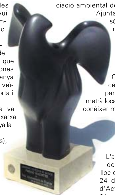
Aquest guardó ja lluíx a les prestatgeries del Saló de Sessions