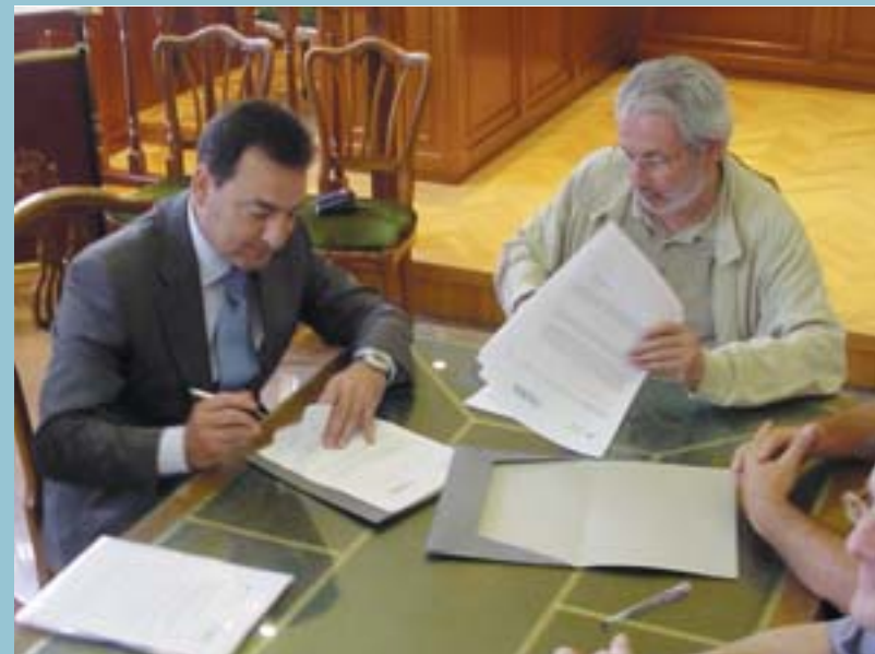
Moment de la signatura del conveni