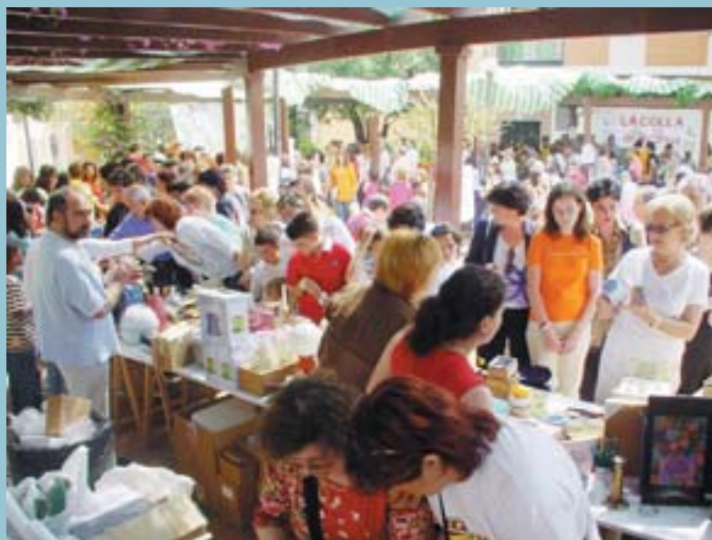
Paradetes a ple rendiment