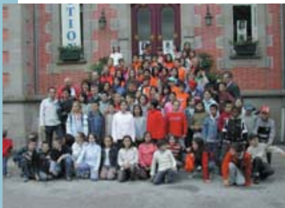
A la porta de l'Ajuntament de Panazol

Com a curiositat: és el viatge en què s'han deixat més efectes personals a les cases de Panazol. Fa unes dies arribà un paquet de 2'50Kg, amb els objectes personals que el nostre alumnat havia oblidat.