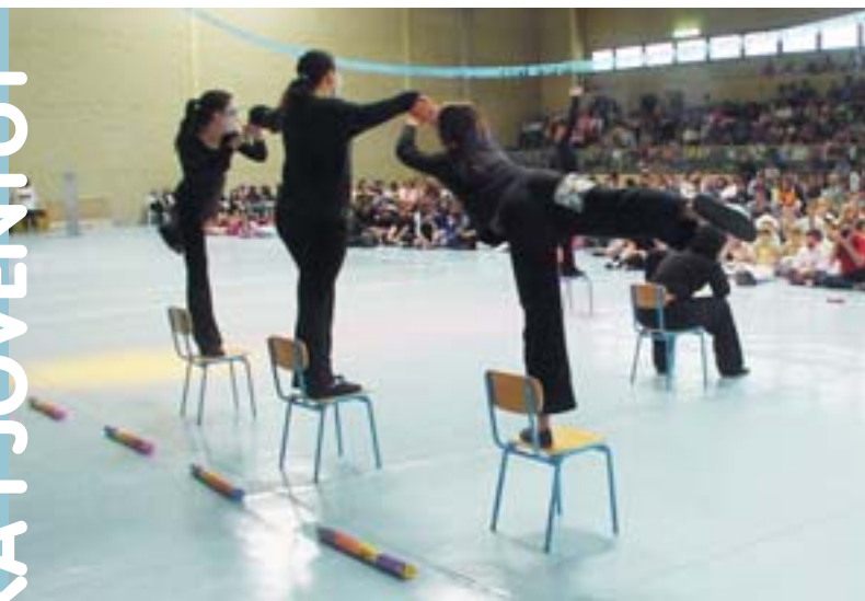
Un moment de les actuacions al Pavelló