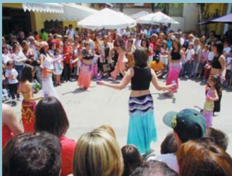
Mostra de dansa del ventre

Una exhibició de dansa del ventre, un concert de música hindú, i l'actuació de l'escola de danses tradicionals donaren color a la gran festa de la solidaritat i la cooperació que, cada any, suposa el "Rastro".