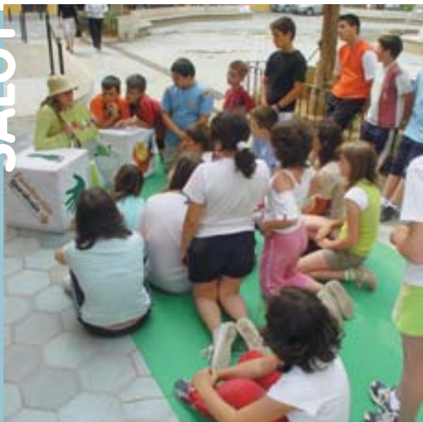
Jocs per a animar el consum de fruites