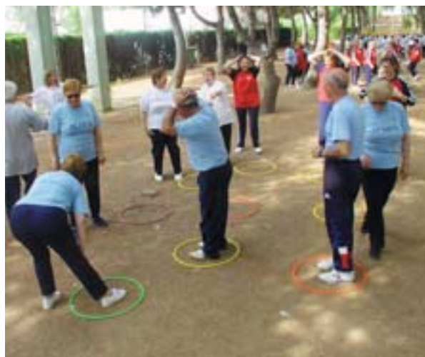
Activitat esportiva al poliesportiu

En alevins, els campions foren Danger seguits de Tridimensionales . En benjamí, el títol fou per a Diablos i la segona posició per a Raptors Juniors .