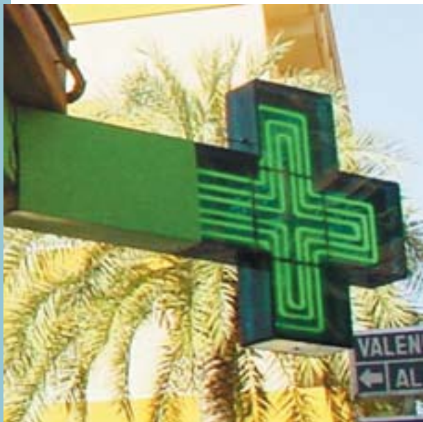
En breu hi haurà una nova farmàcia a Picanya

El passat divendres 10 de juny l'autobús de la Fundació Ruralcaja visità el nostre municipi per explicar als nostres escolars mitjançant jocs interactius i vídeos la necessitat de menjar fruita de forma diària, en una iniciativa que ha recorregut gran quantitat de pobles de la nostra Comunitat i amb què es pretén millorar la qualitat de la dieta dels nostres menuts i menudes on, a poc a poc, la pastisseria industrial va desplaçant aliments molt més recomanables com ara les fruites.