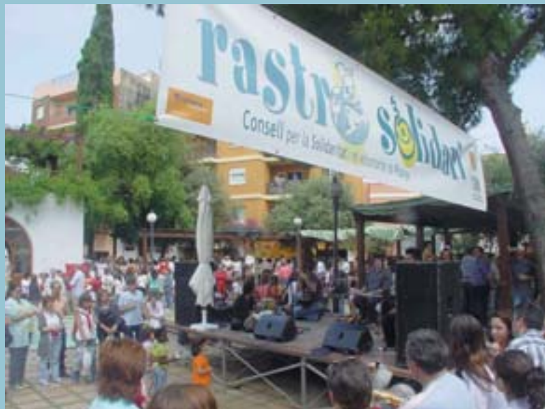
Aspecte de la plaça

Les víctimes del tsunami al sud-est asiàtic seran les destinatàries de l'ajuda