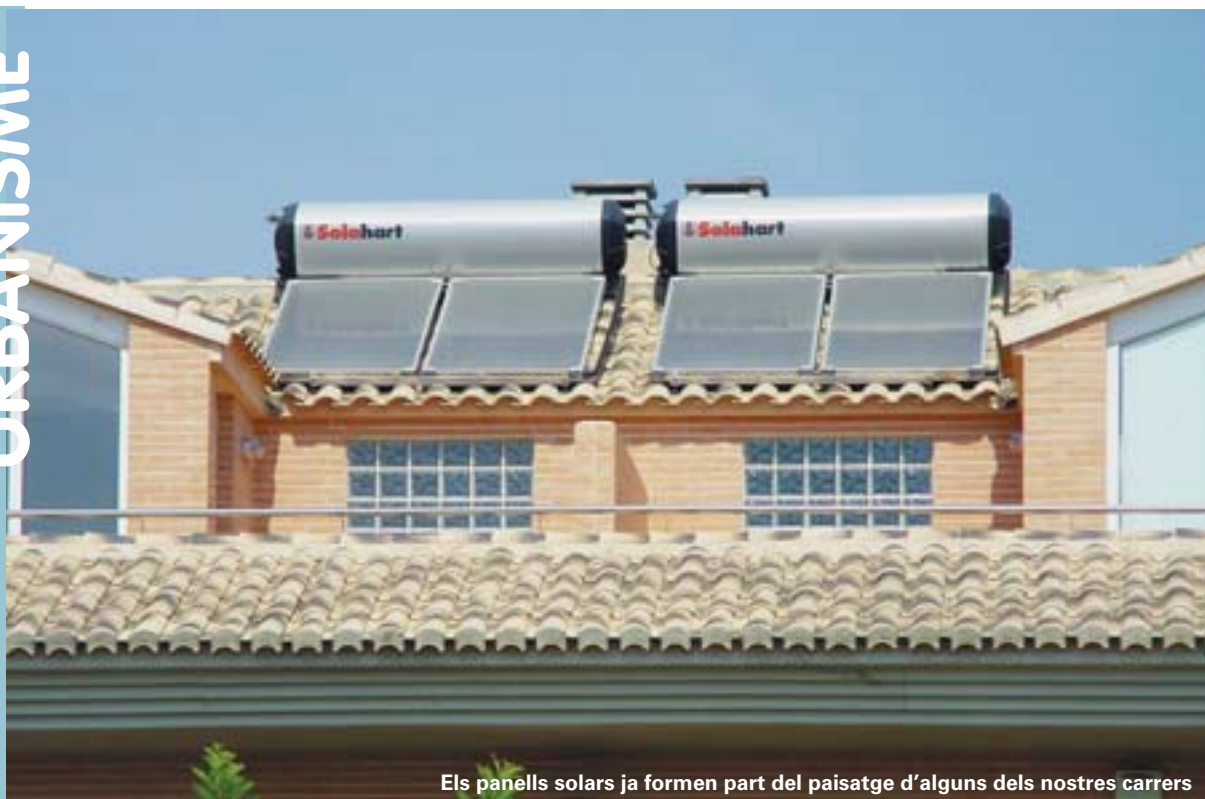
Els panells solars ja formen part del paisatge d'alguns dels nostres carrers