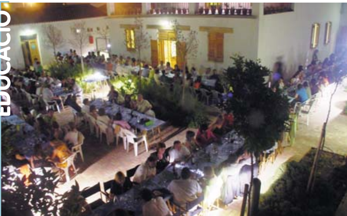
Sopar de celebració dels 25 anys de l'escola Ausiàs March