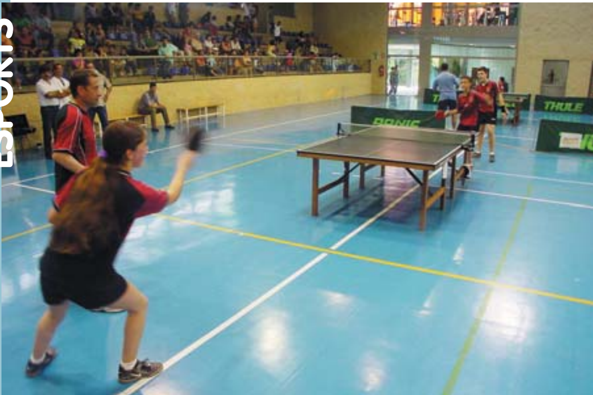
Exhibició de tennis de taula durant la Setmana esportiva