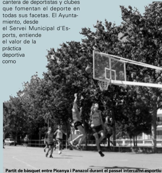
Partit de bàsquet entre Picanya i Panazol durant el passat intercanvi esportiu

mejora de la salud y calidad de vida de los vecinos y vecinas. El buen nivel deportivo de Picanya se constata en la organización de competiciones multitudinarias de proyección autonómica tales como la Quarta i Mitja de Marató o el Cros de la Dona, así como en la existencia de instalaciones deportivas de calidad como el Polideportivo Municipal y el recién construido Pabellón Cubierto. Pero tan importante como disponer de buenas infraestructuras deportivas es hacer deporte y fomentarlo. Este es el principal objetivo del Plan de Actividades anual del Servei Municipal d'Esports. Dicho plan se divide en cuatro programas que se complementan entre sí: Preparación Física, Formación Deportiva, Deporte Recreativo y Deporte de Competición. Alrededor de estos programas giran un sinnúmero de cursos, jornadas deportivas, campeonatos, encuentros comarcales, trofeos, intercambios y escuelas deportivas que cuentan con la participación de población de todas las edades, desde niños hasta mayores de 65 años. La oferta del Ayuntamiento abarca muchas variedades de deportes para niños y niñas, jóvenes y personas adultas y mayores. El objetivo final de toda esta organización es fomentar hábitos sanos entre la población, ocupar el tiempo de ocio con actividades positivas e impulsar el deporte base y de competición. De esta manera no se consigue una pueblo más saludable y con mayor calidad de vida.