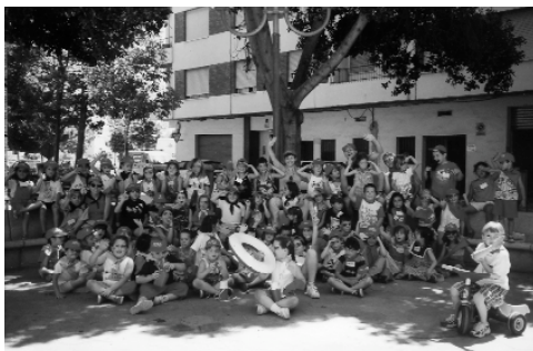
El grup més jove de l'edició de l'any passat de l'Escola d'Estiu