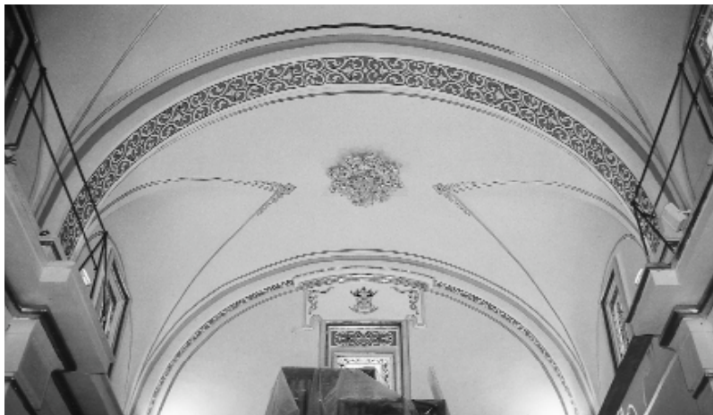
Aspecte del sostre del cor una vegada recuperat.

A l'església de Picanya s'estan realitzant obres de restauració. Aquestes obres pretenen recuperar bona part de la seua bellesa original.