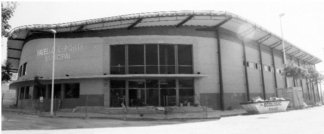
A hores d'ara el Pavelló reb les darreres pinzellades

Les obres del pavelló esportiu de Picanya estan a punt d'acabar-se. De fet els operaris finalitzen els últims detalls i a hores d'ara ja s'ha fixat la data de la inauguració per a la primera quinzena de juny. Per a la inauguració es preveu comptar amb la presència del Conseller de Cultura: Manuel Tarancón. Amb l'obertura al públic de les instal·lacions del pavelló, la pràctica de l'esport farà un salt qualitatiu molt important al nostre poble.