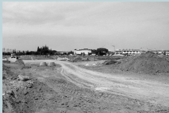
El sector seis (detrás del Pavellón) ya está en pleno proceso de urbanización