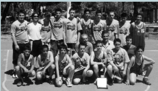
Los equipos de baloncesto de Picanya y Panazol después del partido