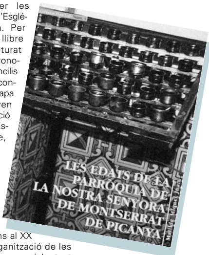
Aquest llibre ja es troba a la vostra disposició a l'Ajuntament