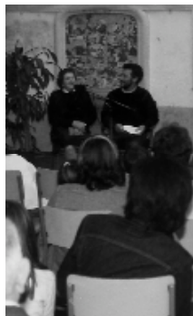
Durant la Marató de lectura es va dedicar un temps als relats de la nostra tradició oral en procés de recuperació