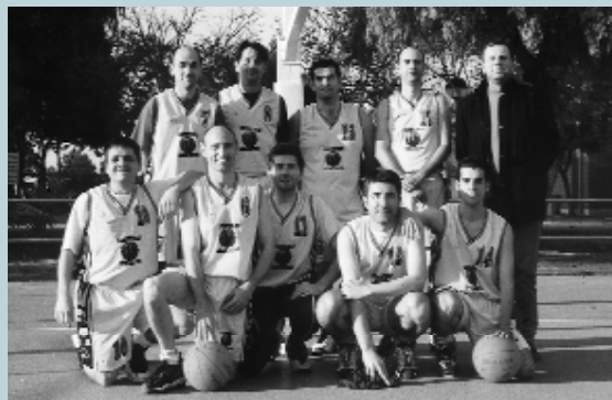
Picanya Bàsquet "B"

jat de tota la Comunitat Valenciana donat que sols ha rebut sis gols en tota la temporada, tot un rècord per a una competició on participen 14 equips. Des d'ací la nostra enhorabona i espenta per a la pròxima temporada on esperem que puguem repetir (difícil millorar) resultats.