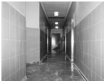
Corredor d'accés als vestidors

L'obertura del pavelló esportiu marca una fita molt important per als amants de l'esport del