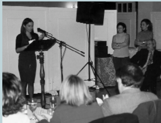
Parlament de les guanyadores durant l'acte de lliurament del 5é Premi a la Investigació d'Estudis Locals