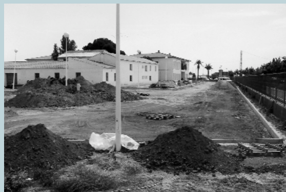
Noves voreres, nous jardins, nova il·luminació al voltant del Centre de Formació i l'Alqueria de Moret

El passat divendres 18 de maig es van realitzar les proves de càrrega del Pont Vell. Quatre camions a plena càrrega van ser els encarregats de comprovar la resistència de les obres de reforma del Pont. La prova va ser un èxit i sembla que els vells pilars del pont, ara reforçats, continuen en plena forma.