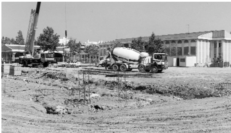
Ya han comenzado las obras que, por el momento, se simultanean con el normal funcionamiento de las clases