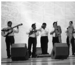
Actuació de música tradicional a càrrec de "Vivencias Andinas"