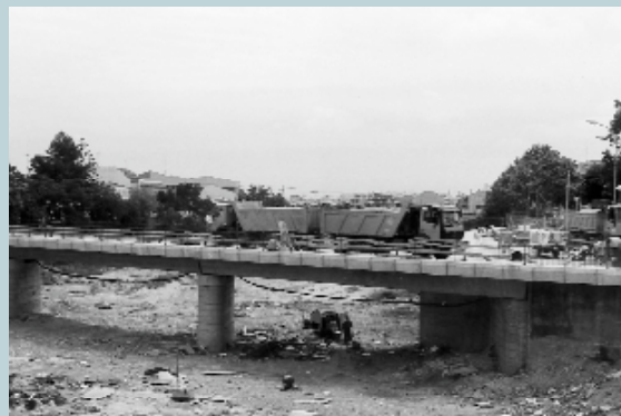
Los camiones, cargados al máximo, probaron la solidez del Pont Vell

Aproximadamente hace un mes se pusieron en marcha las obras del sector 6 en Picanya, sector que coincide con la zona Sur-Este de nuestro municipio. Las obras en este sector comprenden la instalación de la red de abastecimiento de agua potable, el alcantarillado, dividido en una doble red; de aguas pluviales y aguas fecales. En estas obras se procede también a la instalación del alumbrado público, a un completo asfaltado de todo el terreno, gas... Es importante destacar la instalación del sistema de fibra óptica que también se colocará durante esta primera fase de obras.