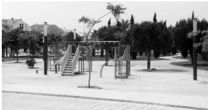
Una nueva zona de juegos para los y las más jóvenes se suma a la oferta existente

Durante el periodo de vacaciones escolares se prevee continuar e intensificar el ritmo actual de las obras, y dependiendo del punto en el que éstas se encuentren, se iniciará la parte más complicada de la adaptación: la parte que afecta al edificio actual. En esta última fase se trabajará sobre el aula existente y se construirá un nuevo edificio, unido al actual que contendrá nuevas aulas, entre ellas la de informática y la nueva biblioteca.