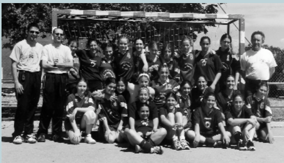
En balonmano, las chicas de Picanya y las de Panazol compartieron su afición por este deporte en un bonito partido