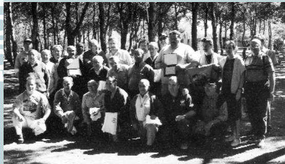
El grupo de petanca después de la competición

El pasado 9 de Mayo volvieron a casa todos los jugadores que participaron en el intercambio deportivo, que como ya es tradicional tuvo lugar este año. Y es que este singular intercambio comenzó a organizarse en el año 1992, desde entonces cada uno de los años que siguieron han sido cita ineludible para todos aquellos que consideraran este encuentro una oportunidad inmejorable para conocer gente y también divertirse.