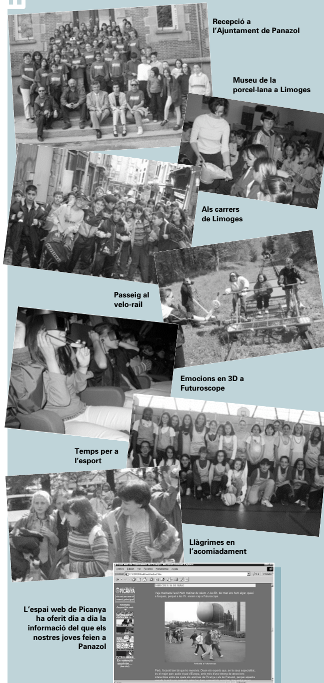
Recepció a l'Ajuntament de Panazol

La tercera setmana de maig s'ha dut a terme l'intercanvi entre les escoles de Picanya i Panazol. Enguany el nostre alumnat ha visitat el poble francès i hem de destacar l'excel·lent acollida que deparenen al nostre grup. Ací teniu algunes de les imatges del viatge.