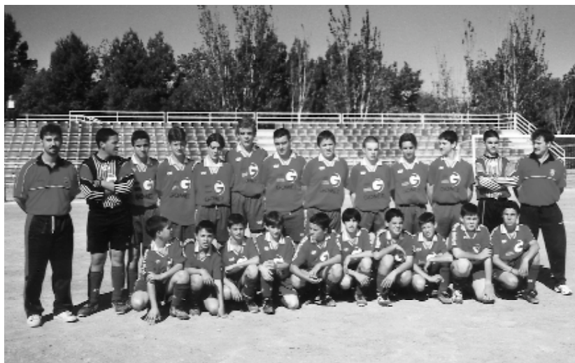
A la imatge l'equip de futbol menys golejat de la Comunitat Valenciana: l'equip infantil del Joventut Picanya