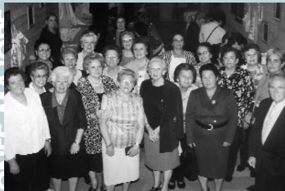
Inauguració de l'exposició de manualitats realitzades per les Persones Majors