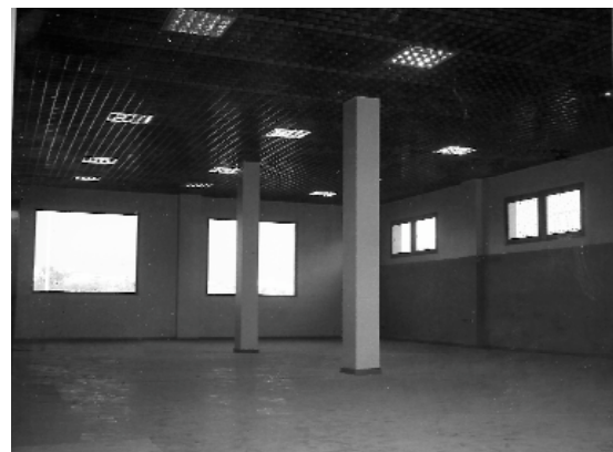
Una de les tres sales multiusos