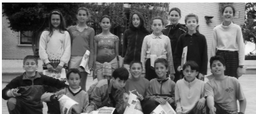
El Consell de Xiquets i Xiquetes durant una de les seues eixides per Picanya

Al dia següent es va celebrar una altra jornada esportiva comarcal, però aquesta vegada els amfitrions van ser els majors d'Alaquàs. El 24 de maig al matí es va realitzar un recorregut per la ciutat de València al bus panoràmic. Aquest autobús té la part superior descoberta i permet observar millor tot el recorregut. Finalment, els nostres majors col·laboraran al Rastro Solidari del proper 10 de juny, que enguany tractarà d'arreglar ajuda per l'Índia.