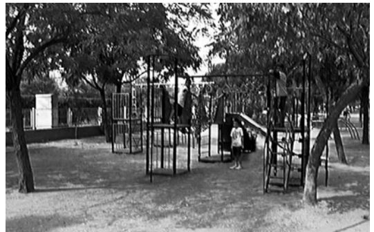
Un nuevo juego en el parque Jaume I, invita a disfrutar a los y las más jóvenes