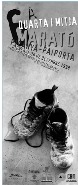
Cartell de la prova

La consolidació de la Quarta i Mitja és fruit de l'esforç de totes les persones que