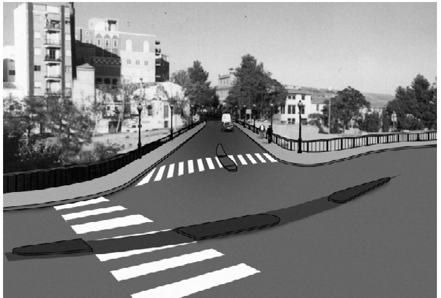
Nou aspecte del pont vell al que destaquen les àmplies voreres, de dos metres, que permetran una major seguretat dels vianants

A més a més, les obres també afectaran a la intersecció d'entrada al pont. Està prevista la construcció d'una mota ajardinada per a regular l'entrada