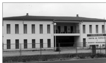
Centro de Formación e Inserción Profesional

Las inscripciones deberán formalizarse en las instalaciones del Centro FIP-Picanya, y en la ADL en el Ayuntamiento.