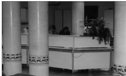
Interior de les dependències municipals

L'Administració del l'Estat i de la Generalitat Valenciana s'obliguen a proporcionar informació a l'Ajuntament dels òrgans que integren les seues