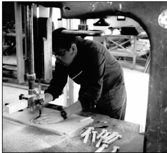
Estudiante de la Escuela-Taller "Alqueria de Moret"

Pero tan importante como la formación profesional es también crear un clima económico adecuado a nivel local, favoreciendo desde el Ayuntamiento la construcción de infraestructuras y de equipamiento para propiciar condiciones favorables de