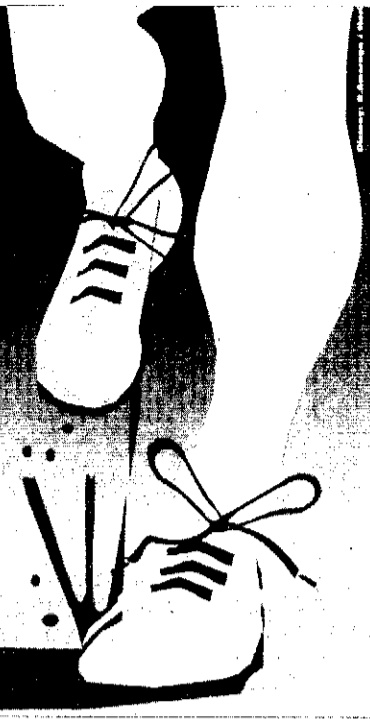
Cartell anunciador de la tercera edició de la Quarta i Mitja.

Edició: Mitja: 10:00 hrs Quarta: 11:00 hrs