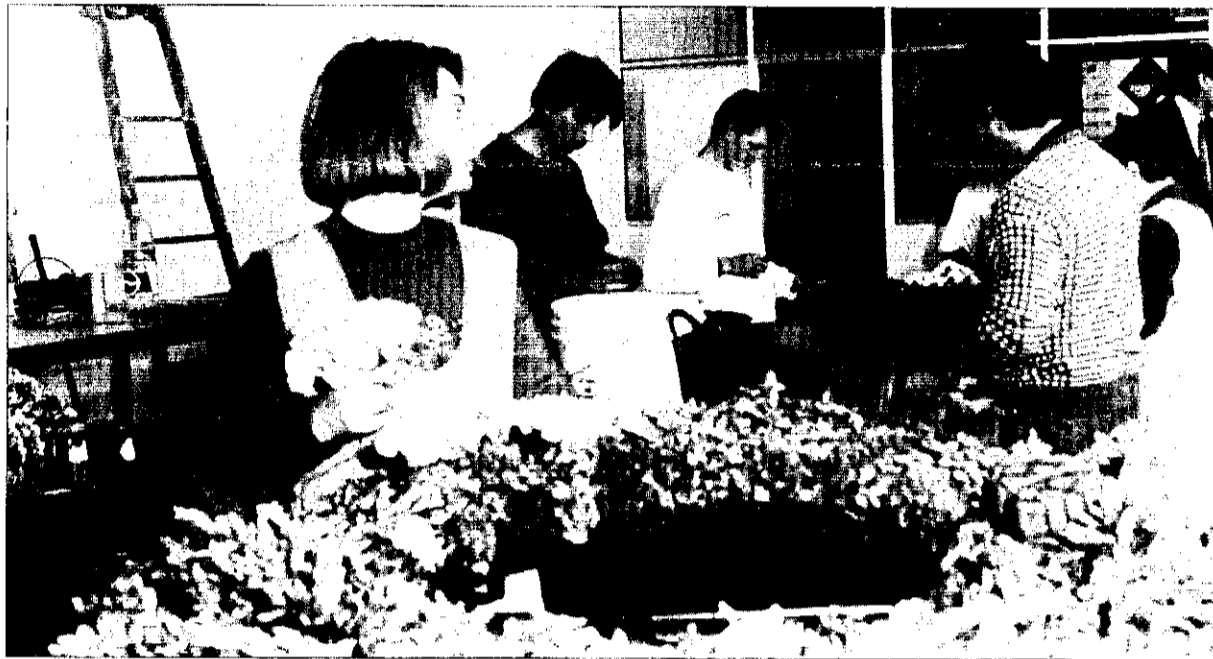
Treballadors de l'empresa "Clavells i flors" de la Mancomunitat de l'Horta Sud, on està integrada Picanya.

L'Ajuntament de Picanya col·labora amb la Mancomunitat de l'Horta Sud en un programa de creació d'empreses. El pla pretén assessorar i formar a persones desocupades per a que creen les seues pròpies empreses. Fins ara hi ha 30 iniciatives en marxa. Aquest projecte és un de tants d'inserció laboral que desenvolupa l'ADL de la Mancomunitat, con el NOW, l'Horizon o l'empresa de minusvàlids Clavells i Flors.