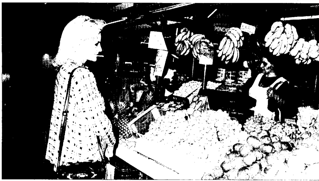
El mercat de Picanya manté actualment una gran vitalitat comercial.