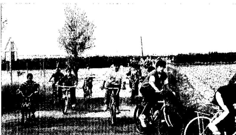
Participants en la prova de Cicle-Passeig.

L'EPA i la Peña Ciclista Tarazona han col·laborat en la prova