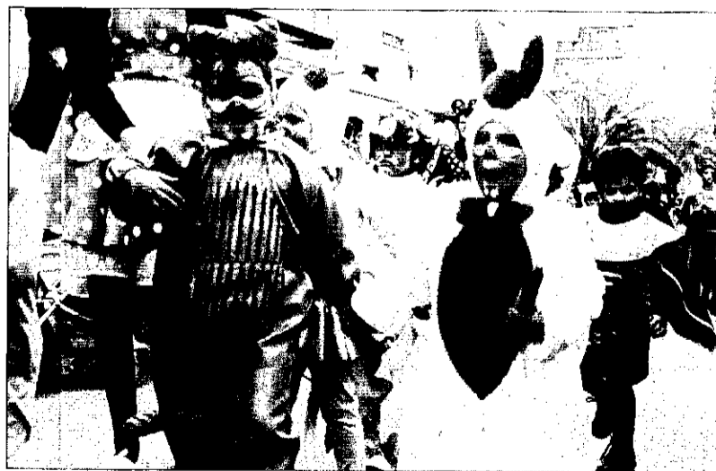
Las sonrisas de los niños de Picanya no faltaron en ningún instante

Así pues, en la variopinta cabalgata, que cruzó, recientemente, las calles de Picanya, los numerosos espectadores y espectadoras pudieron observar desde los disfraces más tradicionales (princesas o bailarinas), hasta los más modernos e innovadores (Pedro Picapietra o Batman). Además hubo grupos de niños con atuendos idénticos, que reflejaban diferentes momentos históricos.