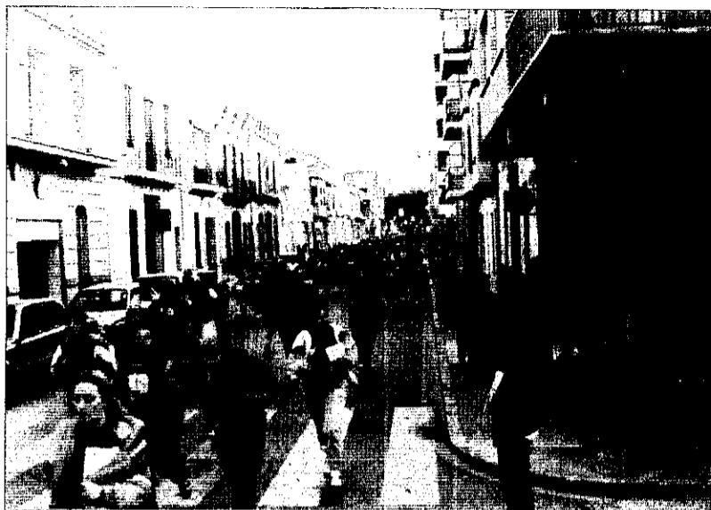
Algunes participants del Recreo-Cross de la Dona

El dimecres 1 de març va ser presentada aquesta nova edició del Recreo-Cross de la Dona davant els mitjans de comunica-