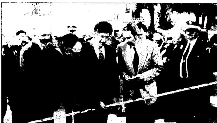
Bernard Delage inauguró el Parc de les Albizies.

Bernard Delage agradeció la cálida acogida del pueblo de Picanya, elogió la singularidad de las fallas y destacó que el Parc de les Albizies es un nuevo logro de una gestión municipal preocupada por conseguir una mayor calidad de vida de los ciudadanos.