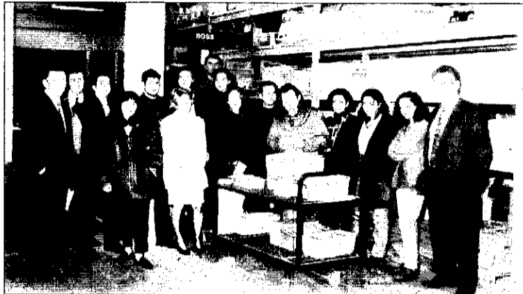
Jóvenes del programa Petra en Panazol.

El alcalde de Panazol manifestó, en declaraciones a De casa en casa , que los objetivos del hermanamiento se están desarrollando con normalidad. "Estamos satisfechos de las relaciones que mantienen Picanya y Panazol. Más que una ciudad hermanada, Picanya es una hermana y vamos a continuar en esta línea", afirmó.