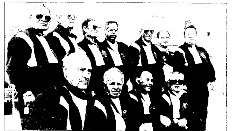
Membres del Club Petanca Picanya.