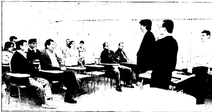
Presentació de les jornades.

El primer dia de les jornades es va tractar la delimitació de les competències del massatgista i es va projectar un vídeo sobre tècniques de massatge terapèutic i esportiu. Els assistents van poder aprendre també alguns