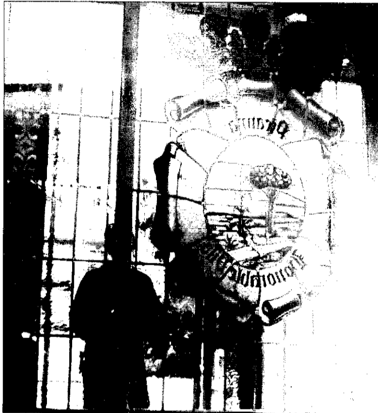
Entrada a l'ajuntament.

L'ajuntament, preocupat per la millora del servei que dóna als ciutadans i ciutadanes de Picanya, ha posat en funcionament el Centre d'Informació i Gestió. És un servei situat a la planta baixa de l'edifici de l'ajuntament que ofereix informació als veïns sobre les activitats i serveis municipals i la gestió de determinats tràmits administratius que no requereixen demora. L'horari d'atenció al públic és de 9 del matí a 9 de la nit, de dilluns a dissabte. El nou centre està totalment informatitzat i atés per dos funcionaris en col·laboració directa amb les quatre secretaries d'àrea.